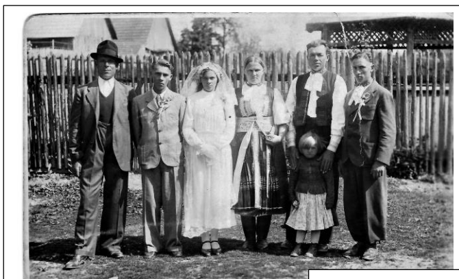
Birmovka u Rácovcov